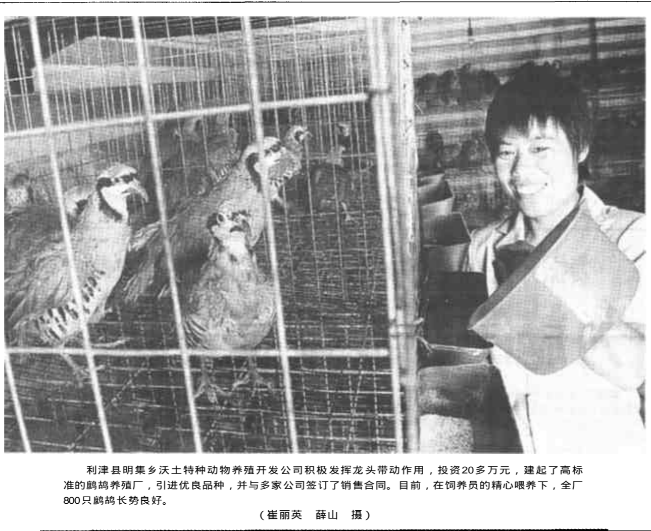
利津县明集乡沃土特种动物养殖开发公司积极发挥龙头带动作用，投资20多万元，建起了高标准养鸡场。

他们以建立健全街道社区服务中心为主体，社区服务站为依托，社区志愿者队伍为基础的三级社区服务网络。