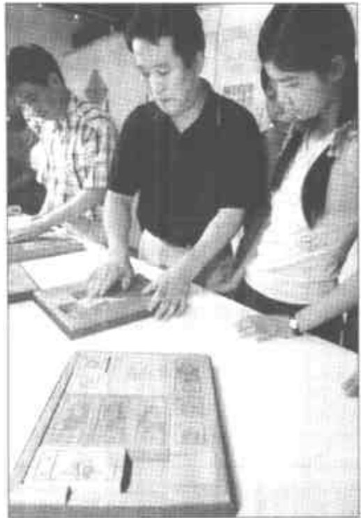
8月19日,在北京科技馆举行的中国古典数学玩具展上,工作人员向观众介绍如何操作华容道玩具。这次展览通过图文和实物及可供观众动手参与的展品,向公众介绍九连环、七巧板、华容道、鲁班锁和四喜人等中国古老益智玩具。

通知要求,完成新阶段“菜篮子”工作任务,实现“两个转变”,必须对“菜篮子”产品质量卫生安全实行“从农田到餐桌”的全过程管理。要加快“菜篮子”产品质量卫生安全标准和检验检测体系的建设,抓紧制(修)订与“菜篮子”产品相关的质量卫生安全标准,加大“菜篮子”产品检验检测工作力度,建立“菜篮子”产品质量卫生安全追溯制度,建立与“菜篮子”产品有关的认证认可和标识制度,对卫生安全不合格的“菜篮子”产品实行无害化处理或予以销毁,对造成危害或严重后果的,应依法予以处罚。要加大“菜篮子”产品生产环节监管力度,强化动植物病虫害防治,从源头上保证产品安全卫生。要建立安全的“菜篮子”产品产销经营体制,加快“菜篮子”产品市场基础设施建设,积极推广现代营销方式和流通组织形式,严把批发市场和零售市场入口关,规范批发市场和农贸市场秩序。要加强“菜篮子”产品进出口质量卫生安全管理,加强科学技术研究、引进与推广,完善和落实各项扶持政策,加大投入力度,完善重要“菜篮子”产品储备制度。