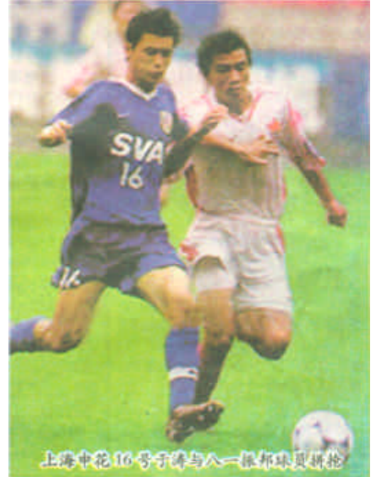
上海申花16号号手博与八一振振球员拼抢,今天也大出风头,完成了本赛季首个帽子戏法。在济南,山东鲁能泰山队主场以3比1战胜多名主力缺阵的青島哈德门队,继续着自己今年主场全胜的步伐。

在上海,申花队打“疯”了。他们在虹口体育场以7比1狂胜八一振振队。这是申花队在今年联赛中的第四场胜利。在申花队坐足了冷板凳的曲圣卿今