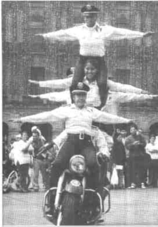
8月18日,墨西哥女警察在墨西哥城索卡洛广场向市民表演摩托车特技。30多名墨西哥女警察参加了由墨西哥城公共安全部门主办的名为“警察与市民同乐”的活动,其目的是使市民了解警察的特殊工作和生活,让更多的人将来从事安全保卫工作。