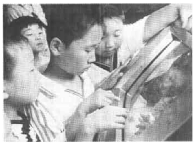
近日,笔者在青岛“海尔”科技馆里看到许多不同省市的旅游者纷纷来到这里参观。在这里,暑假随父母出游的孩子们最多。通过参观,孩子们感到了只有努力学习科学技术,才能使自己的国家强大的真理。

花官乡的庄户剧团深受欢迎,遇有集会庆典、企业开张、续修家谱、婚嫁寿诞,有的主家便登门约请。庄户剧团来自农村,他们了解父老乡亲在文化消费上的承受能力,因此,定价就比较实际,剧团的收费每场在200至300元之间,每个庄户剧团年收入5至7万元。因此可以说,花官乡农民自发组织剧团已经形成了一种文化现象。花官乡在党的改革开放和富民政策的指引下,花官